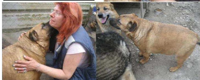
... hier noch im Asyl