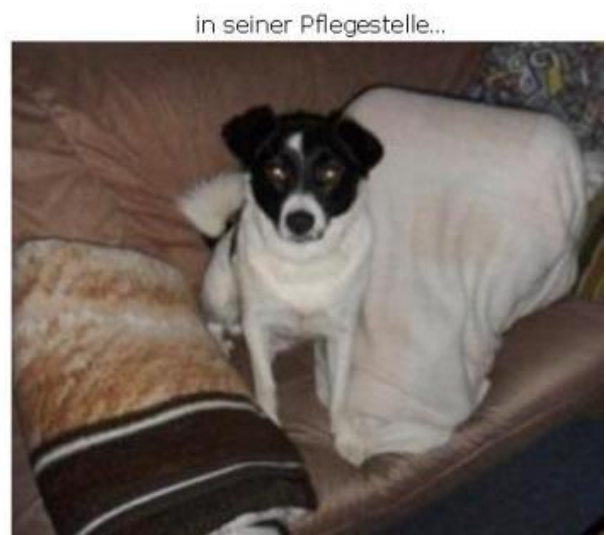
in seiner Pflegestelle...